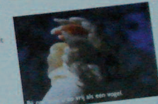
Bij verkoop van uw vlieg als een vogel.