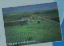
Het gras is ook groener.

Sanne Wind Makelaardij is zich bewust van de affiniteit die agrariërs hebben met de omgeving waarin ze werken. Zakelijke beslissingen worden in deze sector dan ook vaak met het hart genomen en dat begrijpen wij heel goed!