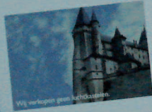
Wij verkopen geen luchtballonnen.