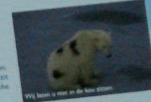
Wij horen u niet in de kuu zitten.