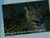
Wij houden de markt steeds in de gaten!

Sanne Wind Makelaardij is aangesloten bij de grootste brancheorganisatie in de makelaardij, de Nederlandse Vereniging van Makelaars in onroerende goederen en vastgoeddeskundigen NVM. Het NVM logo is in de loop der jaren uitgegroeid tot een keurmerk van professionaliteit en kwaliteit. De NVM-makelaar is een specialist die het hele traject van een aan- en verkoop voor u kan begeleiden.