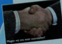
Mogen wij ons even voorstellen!

De onroerend goed markt is een 'spel' van vraag en aanbod. Het aan- en verkopen van onroerend goed vergt inzicht. Sanne Wind Makelaardij beschikt hierover voldoende jarenlange ervaring. Wij zijn onafhankelijk, objectief en deskundig in de woning-, bedrijfs- en agrarische makelaardij.