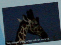
Wij stellen graag onze nek uit voor u.