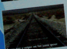
Samen met u volgen we het juiste spoor.