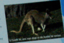
U heeft bij ons maar één ding in de hand: de rust!

Bijvoorbeeld wel uw woning op Funda.nl, maar u doet zelf de bezichtigingen en/of onderhandelingen. Door gebruik te maken van deeldiensten, bespaart u de courtage!